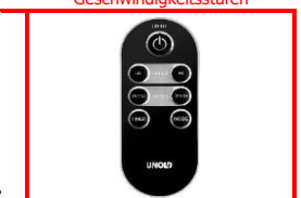
Mit praktischer Fernbedienung

Änderung und Irrtümer in Ausstattungsmerkmalen, Technik, Farben und Design vorbehalten. © UNOLD AG