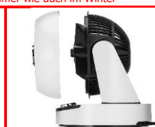
Abnehmbares Frontgitter zur leichten Reinigung